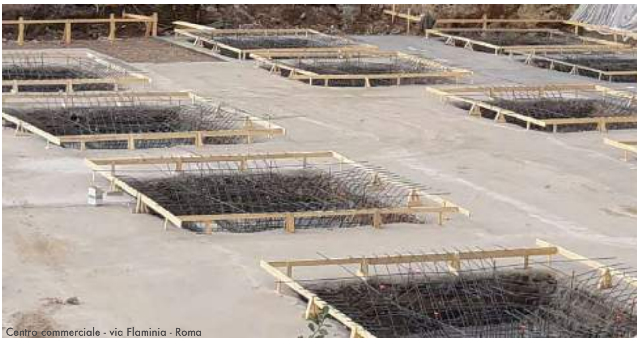
Centro commerciale - via Flaminia - Roma

La sinergia con la nostra rivendita edile ci da la possibilità di fornire al cliente tutta la gamma di prodotti di completamento della carpenteria a partire dal materiale di consumo come tavole, morali, pannelli per casseforme, distanziatori, matassine e chiodi , passando per tutta la gamma dei diversi tipi di solai fino al servizio di noleggio di miniscavatori piattaforme aeree e piccole utensilerie come martelli pneumatici e trapani .